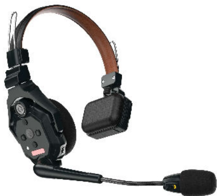
Casque 1 oreille HF