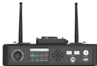
Hub & Antennes