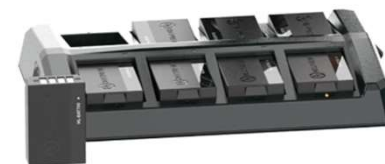
Station de charge & 8 batteries