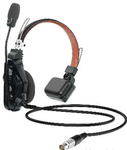
Casque 1 oreille filaire