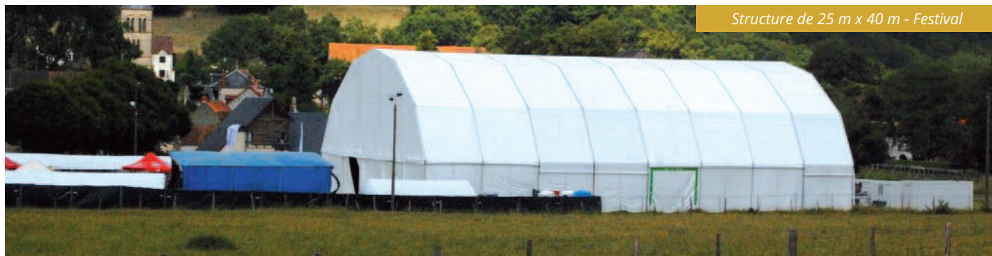
Structure de 25 m x 40 m - Festival