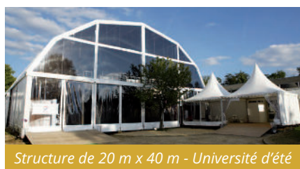
Structure de 20 m x 40 m - Université d'été

Avec un look résolument original, ces structures abritent un vaste espace modulable sur un ou deux niveaux ouvrant de nouvelles perspectives dans la conception événementielle.